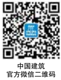
中国建筑官方微信二维码