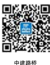
中建路桥企业号二维码