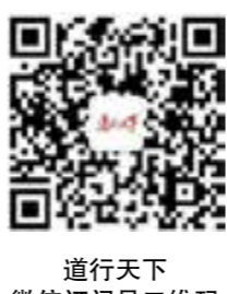
道行天下微信订阅号二维码